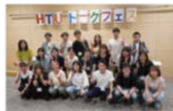
HTU トークフェス (2025年8月) より

職場の課題をきちんととりあげ、解決することができるのは、私たち「労働組合」です。